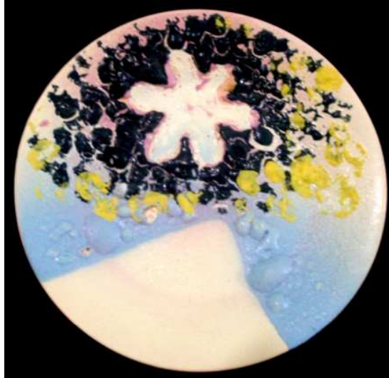
شكل رقم (٢)