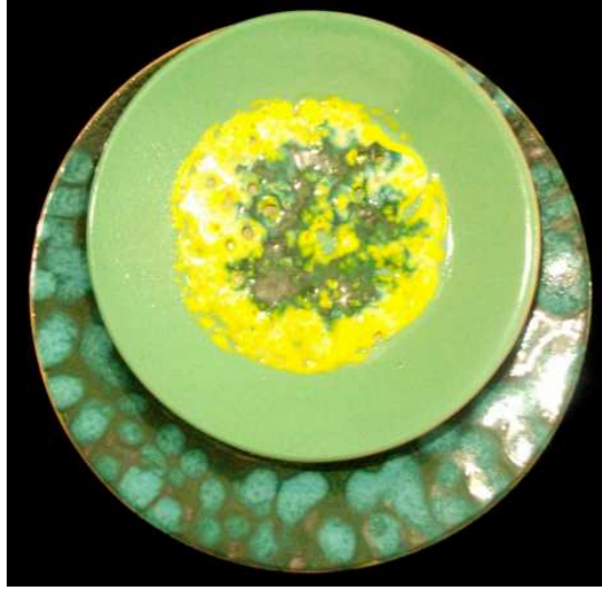
الشكل رقم (٦)