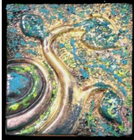
شكل رقم (٣) بعد عملية الاختزال الكيميائي

اللون : يظهر اللون الأخضر الغامق على ورقة الشجرة وبعد عملية الاختزال الكيميائي ظهر باللون النحاسي البراق ، والملمس الخشن في الأرضية مع دكائة اللون أظهر الشكل بوضوح حيث أن الشكل البارز يتم بملمس ناعم وبريق معدني بعد عملية الاختزال الكيميائي له مما ساهم في تأكيد العنصر الشكلي المختلف في تباينه اللوني وهيئة مساحته عن الخلفية الملمسية المحيطة به لذا يبدو الشكل هنا أكثر قوة واندفاعا للأمام في انسجام متباين مع خلفيته .