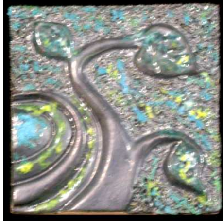
شكل رقم (٣) قبل عملية الاختزال الكيميائي