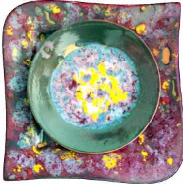
المظهر السطحي للخلطة (ج- ٤) عند ١٠٧٠م

- وعند زيادة درجة الحرارة إلى ٩٠٠م تبدأ مجموعة كبيرة من الفقاعات بالانفجار مكونة ثقوب في سطح الطلاء.