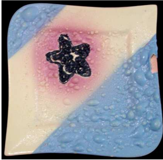
شكل رقم (١)