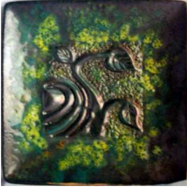
المظهر السطحي للخلطة (١- ب) عند ١٠٥٠م