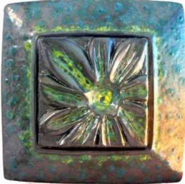
المظهر السطحي للخلطة (٣- ج) عند ١١٢٠م