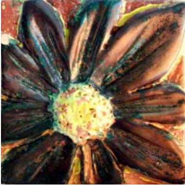
المظهر السطحي للخلطة (١- ج) عند ٥٠م