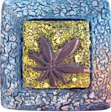
المظهر السطحي للخلطة (٣- أ) عند ٨٥٠م