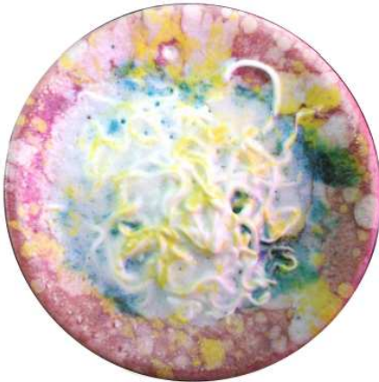
المظهر السطحي للخلطة (٢) عند ١٠٥٠م

المصمم من استخدامها في بعض التوكسيات الخزفية الحائطية وغيرها من التشكيلات البنائية في الواجهات المعمارية والميادين والحدائق ب- ويظهر ملمس ناعم بدرجات اللون الأخضر الداكن يميل إلى الأسود وذلك بسبب تفاعل وانصهار أكسيد النحاس في تركيبة الطلاء عند درجة حرارة تتراوح بين ١٠٢٠ : ١٠٥٠م واتي يمكن تكوينها فنيا كوحداث وبلاطات وترابيع خزفية تخدم التشكيلات الجمالية للمجسمات والمسطحات الخزفية في الأماكن العامة والقاعات الخاصة .