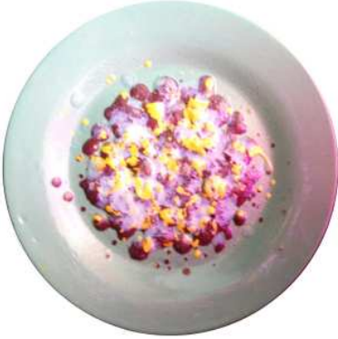
المظهر السطحي للخلطة (٣- ب) عند ١٠٥٠م