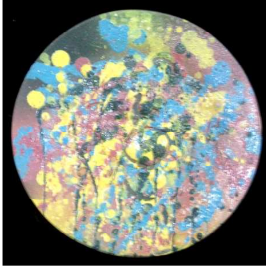
الشكل رقم (٧)