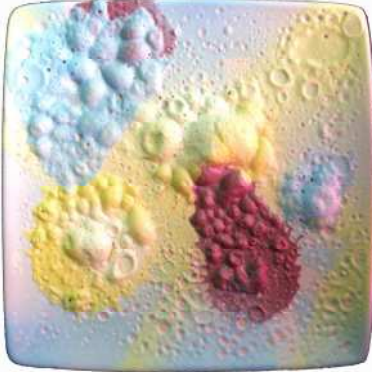
المظهر السطحي للخلطة (أ- ٤) عند ٨٥٠م