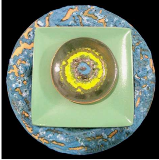
شكل رقم (٥)