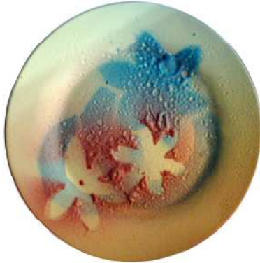
المظهر السطحي للخلطة (ب- ٤) عند ٩٥٠م

- بزيادة نسبة أكسيد الألومنيوم إلى ١٥٪ من تركيبة الطلاء فإن السلوك الحراري للطلاء يتغير أثناء عملية الانصهار فعند درجة حرارة ٨٥٠م يبدأ الطلاء بالانتفاخ مكوناً فقاعات لم تنفجر.