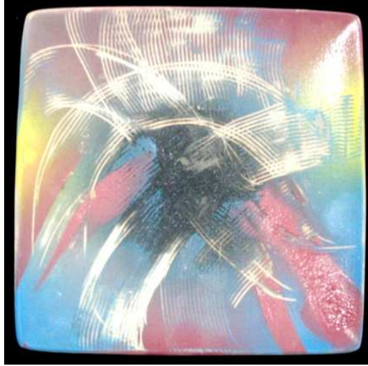
شكل رقم (٤)